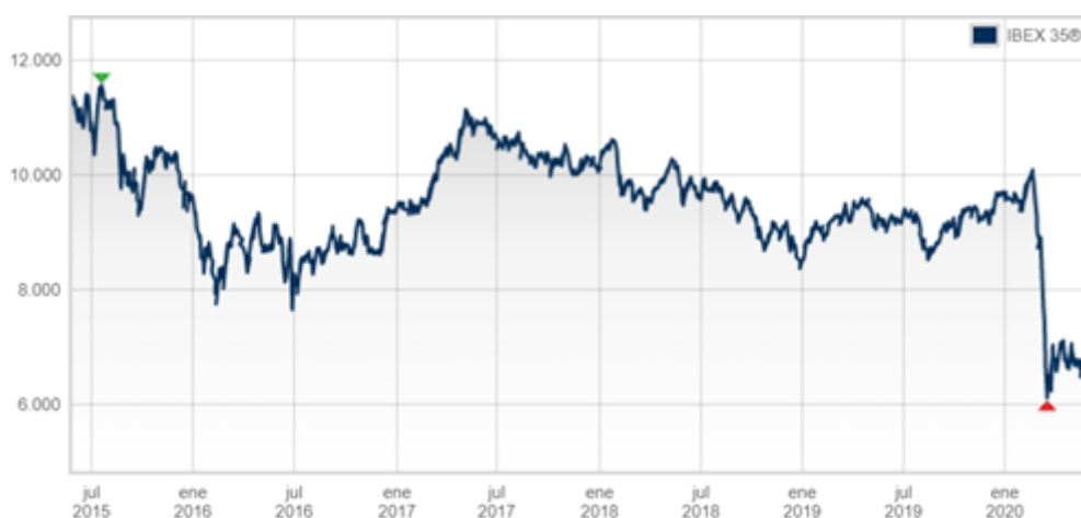
Imagen 1. Bolsa de Madrid. (2020). Gráfico índice IBEX 35 [fotografía]. Recuperado de: https://www.bolsamadrid.es/esp/aspx/Mercados/Graficos.aspx?tipo=IBEX.. Consultado el 25/05/2020

En la Imagen 1 podemos observar la fluctuación de las empresas del IBEX 35 desde el año 2015 hasta la actualidad.